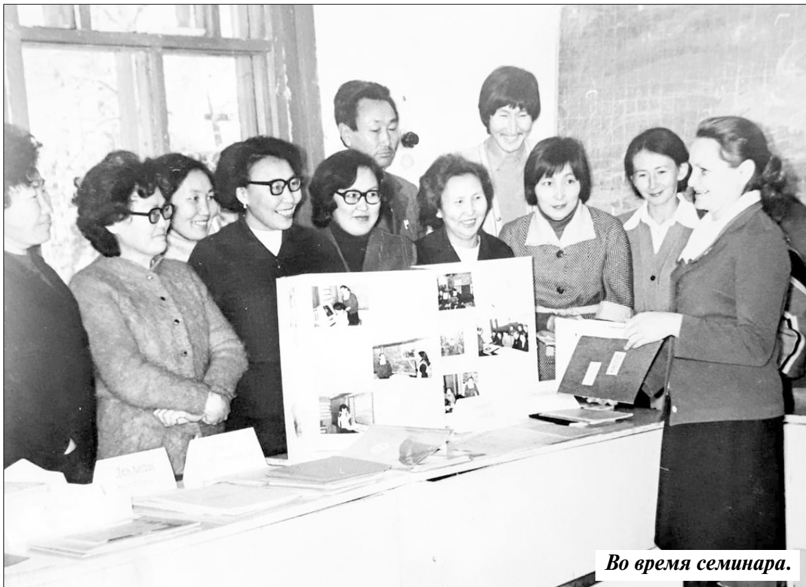
Во время семинара.

— Я родилась в 1937 году в Ленинграде. Когда началась война, мне было 4 года. Первую блокадную зиму я пережила, но ничего не помню, кроме смерти своих родителей. Они умерли от голода. Меня отвели в детдом и летом 1942 года эвакуировали в г. Переславль Ярославской области. В детдоме я прожила два года, в