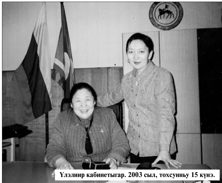
Үлэһит кабинеттар. 2003 сыл, тохсунньу 15 күнэ.