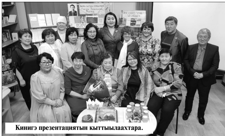
Кинигэ презентациятын кыттылаахтара.