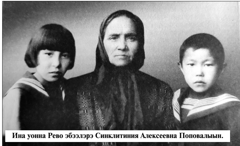
Ина уонна Рево эбээлэрэ Синклитиния Алексеевна Поповальын.