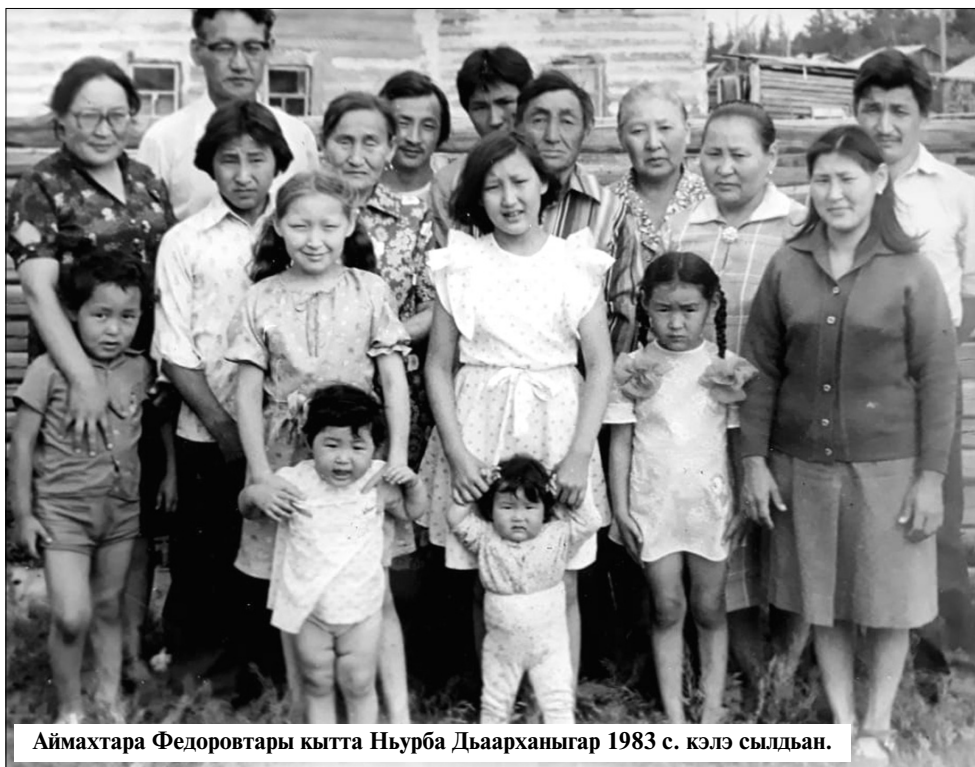
Аймахтара Федоровтары кытта Ньурба Дьарханыгар 1983 с. кэлэ сылдьан.

Ити туһунан кини бэйэтэ манньк ахтар: "Мы производили теоретические расчеты системы защиты радиолокационной станции (РЛС) от воздействия на нее пассивных помех, так называемой селекции движущихся целей. В ходе движущихся целью было обнаружено, что защитить РЛС от воздействия пассивных помех можно, но если самолеты будут лететь с определенной скоростью, то они становятся невидимыми для локаторов, даже оборудованных системой СДЦ. Эти скорости мы назвали "слепыми" скоростями. Эта проблема долго не решалась".