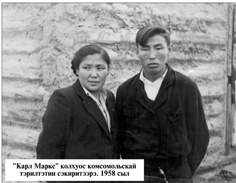
"Карл Маркс" холкуос комсомольскай тэрилтэтин сэкиритээрэ. 1958 сэл

игини манган баттахтаах, сэгийэтигэр манган бытыктаах кырдыаас киһи көрүбүтэ. Ол Социалистическай Үлэ Геройа Петр Хрисанфович Староватов этэ. Хантан сылдыарбытын ыйыталаһан баран "Оҕолоор, эдэр дьон эһигиттэн олус үөрдүм, долгуйдум, бары Бүлүү эбэбит ыччаттара эбикит, кытаатан үөрэниң. Эһиги билигин билбэккит - бу Бүлүү Эбэбит баайын-дуолун" - дииэн баран хостору биер-биер көрдөрөн, бүтэһигэр хатыылаах турар хоһу аһан көрдөрбүтэ. Онно араас элбэх таас баар этэ. Ону барытын сурулла сылдыарын көрдөрөн, сыа-сым курдук тутан, наҕыллык туохха туһалаах таас буоларын кэпсээбитэ. Онно бары сөхпүпүт - Бүлүү өрүспүт хайдах курдук элбэх баайдааһын, хайдах курдук инникитигэр кизгэ арыыйылар күүтэллэрин оччотообуга ким билиэй".