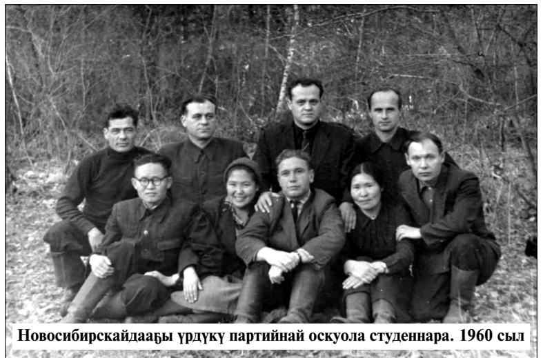
Новосибирскайдаағы үрдүкү партийнай оскуола студенттара. 1960 сэл

Хаппыыстаа, оҕурууга хара буортан уонна туйтан кып-кыра көһүйлэри оноруу. Ыалларынан сылдьан ырааһырдар, чэбдигирдэр үлэ араһын ыгыты; оскуолаба үөрэнэр оҕо уроук ааҕар анал миэстэлээх, кинигэтин, тэтэрэтин ууар долбуурдаах буоларын, дьыэ-кэргэн тус-туһунан сотордоох буоларын ирдээһин. Үгүс улахан тутуулар - кулууп, гараж, хотон, сайылык дьыэлэрэ субуотунньугунан тутулуубуттара. Бу манна нэһилиэк бары ыччаттара, тэрилтэбэ үлэлиир эдэр дьон көхтөөхтүк кытталлара. Итини кытта сэргэ художественнай самодеятельность күүскэ сайдыбыта. Ыарахан үлэ кэнниттэн санга кулуупка мустан пьесалары, драмалары, олонхолору туруораллара, санга ырыалары үөрэтэн ыллыыл-