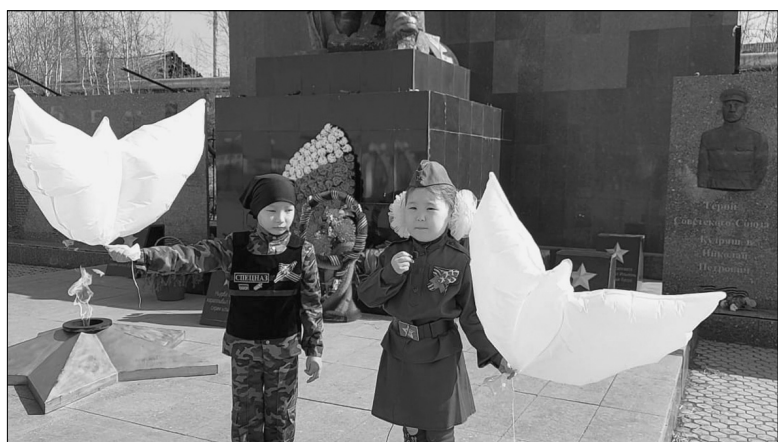
Голубь мира - Ты символ мира и добра, Мой Голубь белый, вольный! Напомни людям, что пора Уже закончить войны!