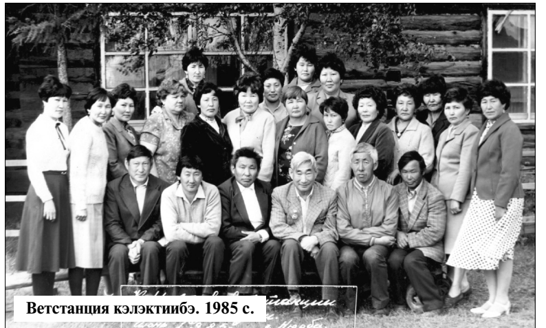
Ветстанция кэлэктибэ. 1985 с.