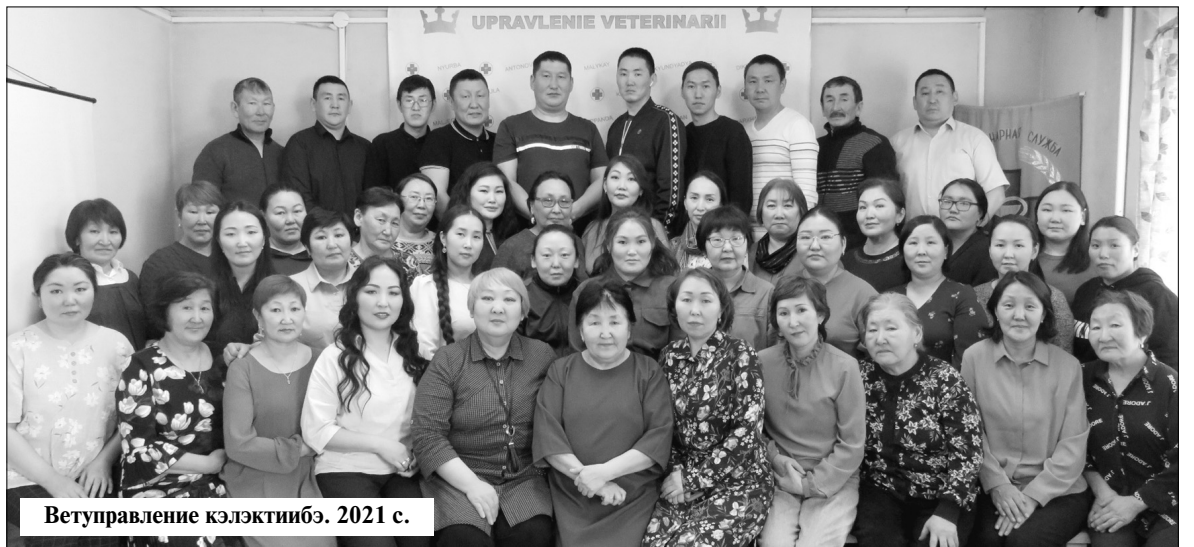
Ветуправление кэлэктибэ. 2021 с.