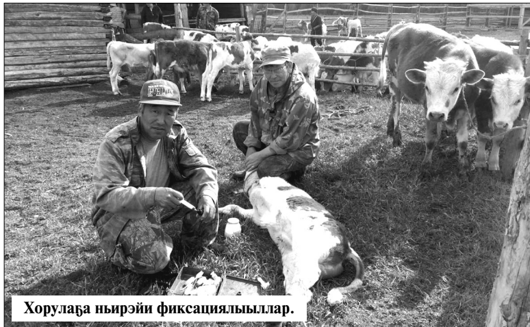
Хорулаба ньирийн фиксациялыыллар.