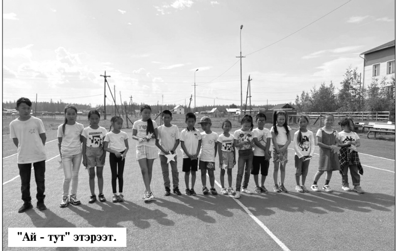
"Ай - тут" этэрээт.