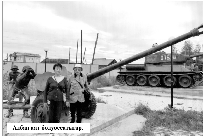
Албан аат болуоссатыгар.