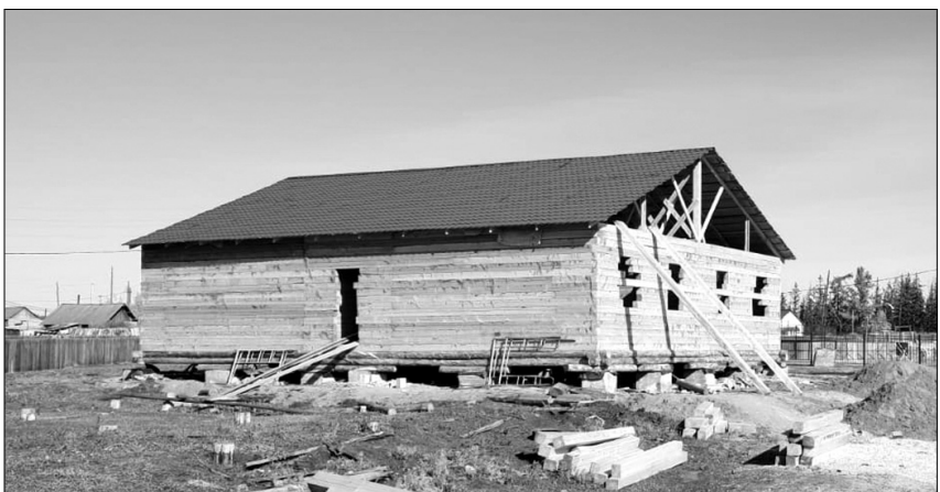
хааччылыылаах уопсай дьизэлэр тутула тураллар.

Улуус сүтүгүтүн үбүлэнэн Дьаарханна дэриэбинэ ортотугар элбэх аналлаах киин таһыгар уонна Ньурбачаанга 4 кыбартыралаах толору