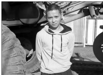
Сэлиэнньэлэр сирдэригэр-уоттарыгар үлэлии сылдьар тэрилтэлэр олохтоох суолталаах боппууостары