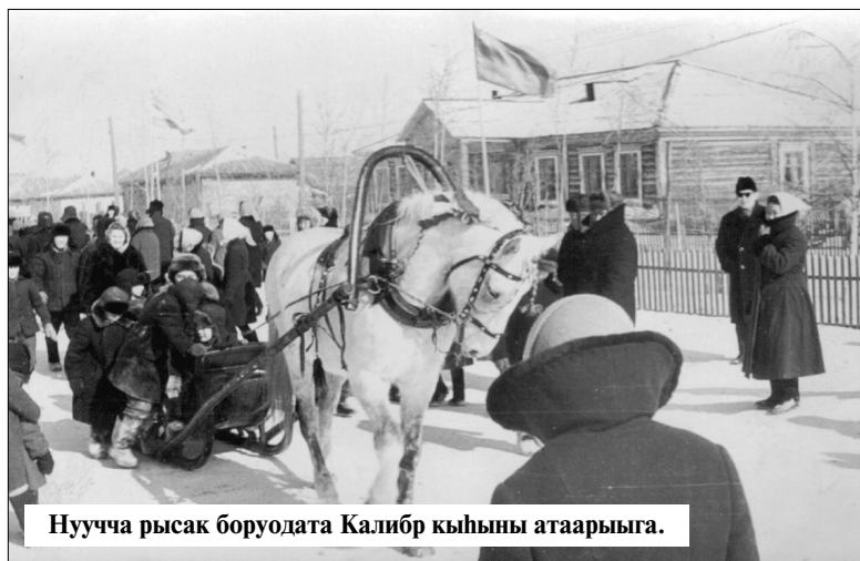
Нуучча рысак бороодата Калибр кыһыны атаарыыга.

Сунтаарга элбэхтик өрө-тангары мэнэйдэһэн аамайдыр этибит диин кэпсээчи. Онно үрэби кыйа сырыһыннаран иһэн ат үрдүттэн аллараанан сүүрэн иһэр сылгыга көбүлүгэр түһэммин тутабан диеммин тарбахпын булгу эрийтэрэн кэбиспитим диин көрдөрөр этэ.