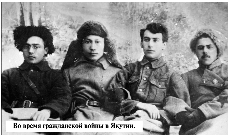
Во время гражданской войны в Якутии.

Но не зря Аммосов всегда посылал его на огневые рубежи.