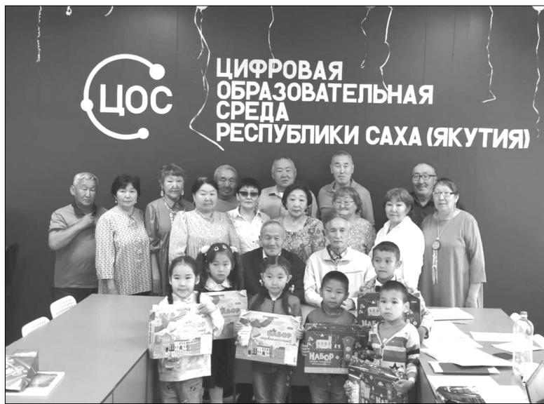
ЦИФРОВАЯ ОБРАЗОВАТЕЛЬНАЯ СРЕДА РЕСПУБЛИКИ САХА (ЯКУТИЯ)