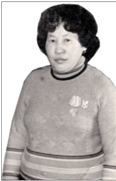
тутан ыланнар, атын сиргэ көһөрөн фермаҕа арыы астыыр дьизэ ғыммыттар.

Мин ыал улаханна буолан, балтыларбын көрөр этим. Манна ололдохпутуна, биһи Борооско күөлүгэр баар икки хостоох дьизэбитин байыаннай нолуокка дьин