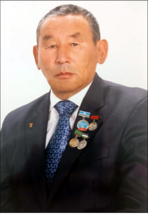
Дойдубуттан отучча снл тэйн баран, ор снлларга биор сопхуоска биоргэ алтынн үлэлэбит киһинн көрсөн истинник кэпсэ-тэн, ааспыгы ахтынн, чачы үчүгэй түгэн көстөн, бу кыра ахтыны суруйарга санан-ным. Баһылай миигиттэн лаппа балыс да буоллар, барыны бары билэринэн, өйдүү снлдыарынан, билэринэн-көрөрүнэн миигин салыннарда, сөхтөрдө.

Урут биор кэмгэ үлэлиирбит сабана манник түгэн көстүбэтэ хомолголоох. Билигин кэлэн биллэххэ, дьылдабыт, ааспыт обо сааспыт майгыннаһар эбит. Мин үстээхпиттэн ийэтэ, сэтгэлээхпиттэн афата суох тулайах хаалбыт буоллахпына, Баһылай афата кини төрүүр сарсыардатыгар - 44 сааһыгар, ийэтэ кини балтараа сааһыгар эмие сэллик ыарыыттан күн сириттэн үс офону тулайах хаалларан күрэнээхтиир. Бу иннинэ үс уол, биор кыыс олох кыра саастарыгар өлөөхтөөбүттэр. Эдьийин Машаны - 12 саастаах кыысчааны Аранастаах детдомугар, убайын Софрону - 5 саастаах уолчааны Куочай обо дьизитигэр биэрбиттэр. Оттон 1,5 саастаах Васяны Нурбатаабы обо дьизитигэр олохтообуттар.