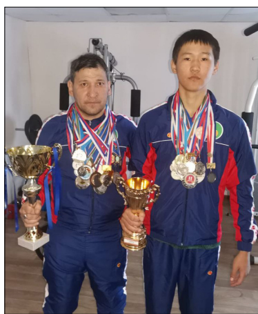
саастарыттан окко-маска үлэлэ-һэн, сүөһү көрсөн тутуах көмө