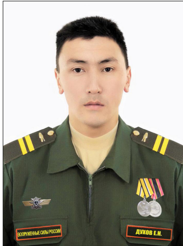
нан кылаастык билиһиннэр эрэ.

– Дорообо! Ньурба Малдыаҕарыгар 1990 с. төрөөбүтүм. Ийэм, аҕам бааллар, пенсионердар. Икки эдьийдээхпин, икки убайдаахпын. Бэйэм үс оҕолоохпун.