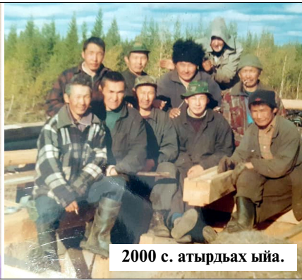
2000 с. атырдьах ыйа.

илиилэринэн солообуттар. Бу барыта ыһыахха дьэри бүһүт.