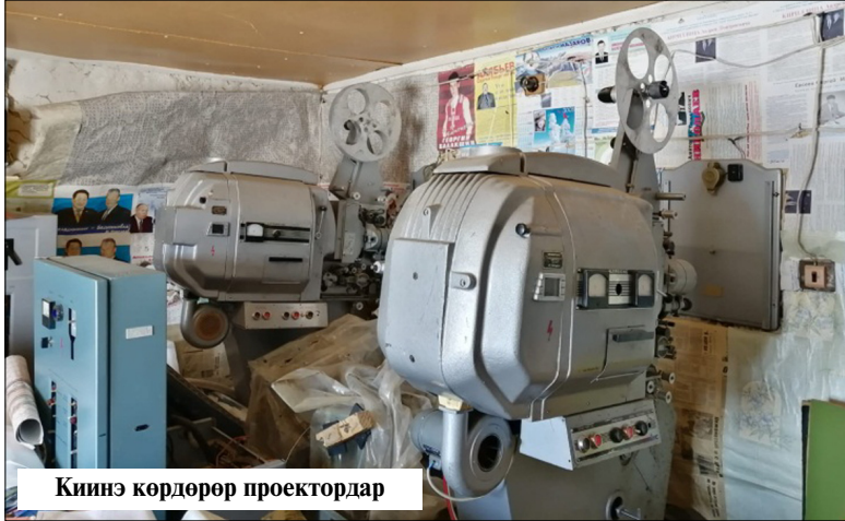
Киинэ көрдөрөр проектордар

XXI-с үйбэ үктэнэн баран, Саха сириг кинематографията, чаччы Аан дойдуга биллэр курдук сайдан, аны дьон аныгы сайдыылаах киинэтеатрдарга сылдыар буолла. Тыаларга култуура дыэтэ, тута сылдыарга табыгастаах чэлчэки проектор баар буоллуттар да киинэни ким бафарар көрдөрөр үйэтэ кэллэ. Анааллаах киинэбуудка, мотуор, киинэ көрдөрөр чуол-баннар, киинэлиэнтэ, бабина, бабина контейнердара, ыарахан, табыгаһа суох киинэ көрдөрөр проектордар, киинэмэхээннык диэн тыллар төрүт туттуллубаттар. Былыргыны былыт саппыта диэн этии, кинематография балысханлык сайдытыгар сөп түбэхэн, ити өйдөбүллөр симэлийбиттэригэр оруобуна сөп түбэхэр. Киинэни көрдөрүү култуурата биһиги сабана итинник этэ дирибитигэр эрэ тийэбит.