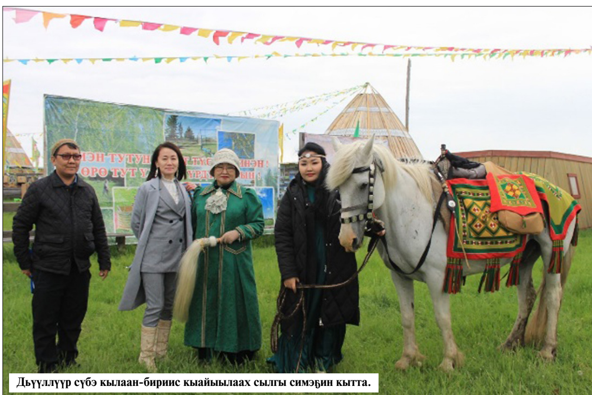
Дьүүлүүр сүбэ кылаан-биринс кыайылаах сылгы симэбин кытта.

К.Д. Уткин аатынан Норуоттар доҕордоһуулары түмэл пуондатыттан Арасыйыба уһуйааччы уонна аҕа сүбэһит, Саха Өрөспүүбүлүкэтигэр Үлэ сылыгар аналлаах, "Үлэ доһоно - Ньурба улуунун киэн туттуулары" уонна кэлэр 2024 сылга буолуохтаах Марха (Ньурба) улууһа төрүттэммитэ 200 сылыгар аналлаах "Улууспут устуоруйатыттан" быыстапкалар туран дьон сэнээриитин ыллылар.