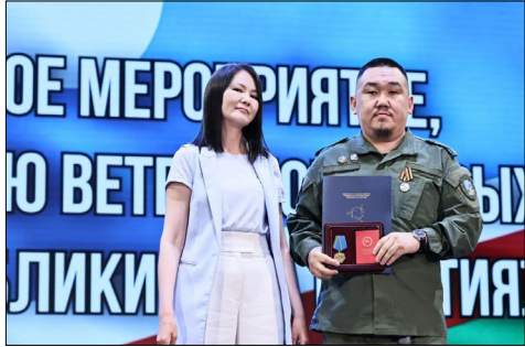
Бу күннэргэ Антоновка киэн тутта, үөрэ кэспирэ үгүс буолла.