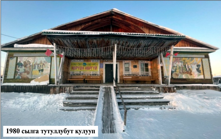
1980 сылга тутуллубут кулууп