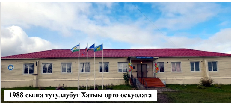
1988 сылга тутуллубут Хатыы орто оскуолата