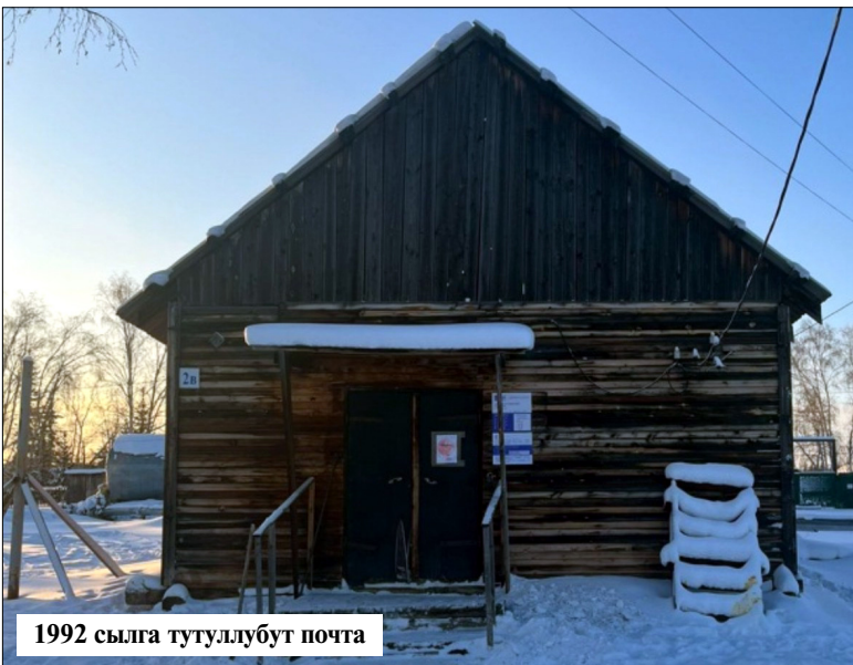
1992 сылга тутуллубут почта