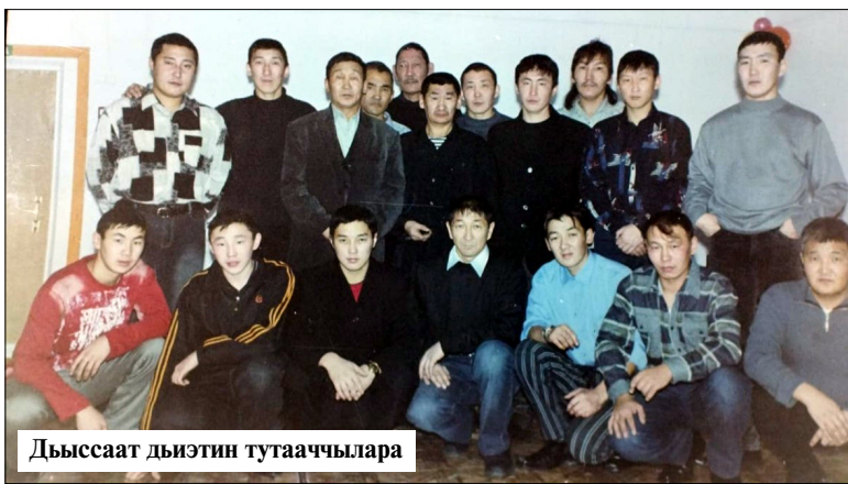
Дыссаат дьэтин тутууччылары