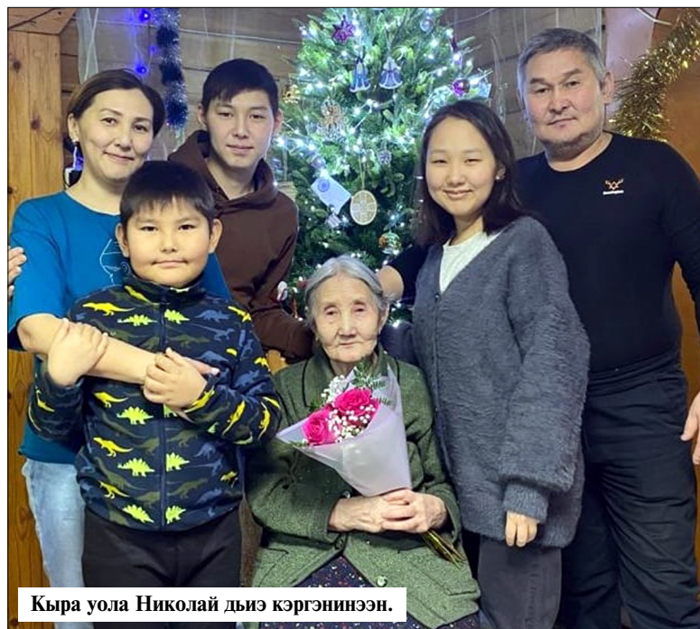
Кыра уола Николай дьиз кэргэнинэн.

Сыйа кини санаатын сарбынньахтарын сааһылаан сүрбэр итии иһийинэн суруллубут түгэннэ ыалдыттаата. Ол курдук, бири үтүө күн ийэлэрэ холкуос мунһа-быттан кумаахыга суламмыт таһаһы кыбынан кириэн кэлбит. Үрдүгэр саба түһэн көртөрө торукуо матырыйал эбит, бастын ыанныксыт кыргыттарга ийэлэрэ көстүүм тикпит, үчүгэйдик үлэлээн истэххит аайы бу бастагы бириэмийэбит аһылаат ууран эркингит өссө көхтөөхтүк тахсан иһиэбэ диэн албаабыт. Таайыт