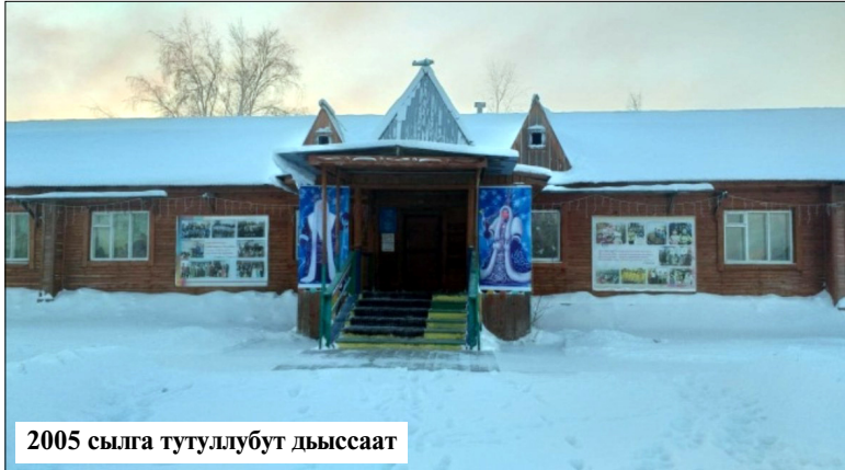
2005 сылга тутуллубут дыссаат