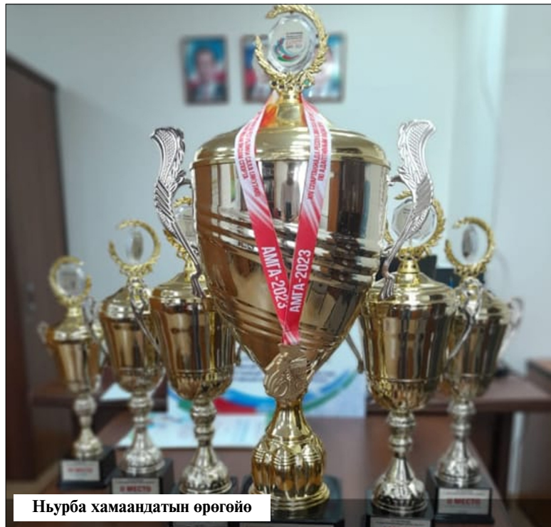
Ньурба хамаандатын өрөгөйө