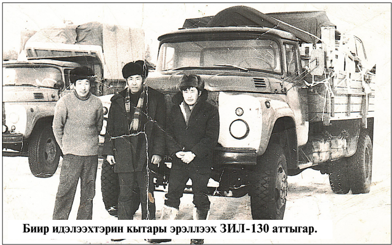
Биир идэлээхтэрин кытары эрэллээх ЗИЛ-130 аттыгар.

Ньурбага үксүн чох таһытыгар сылдыбытым. Кириэптэн хо-