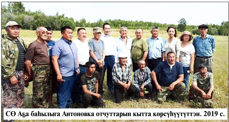
СӨ Аһа баһылыга Антоновка отчуттарын кытта көрсүһүүттэн. 2019 с.

чуолнайдарынан таһар этибит, ол саһана чоһунан оттулар дьэ элбэх. Кирдээх үлэ, ол эрэн сирбэкин-талбаккын. Массыына алдынаһына даһаны өрөөн олобноккун. Өрөөтөххүнэ кыра харчыны ааһаһын, ол иһин түргэнник сапчааһын булан, онгостон, сүүрдүбүтүнэн бараһын. Оччоһуна эрэ нэрээт ааһаһын. Ким даһаны үлэһит дьон таһаарбат, барыта бэйэн баһаһынан сылдыбын. Үлэ чаһа дьон улахан суох. Оһолортор арылаах килиэп сизтэри үлэтигин.