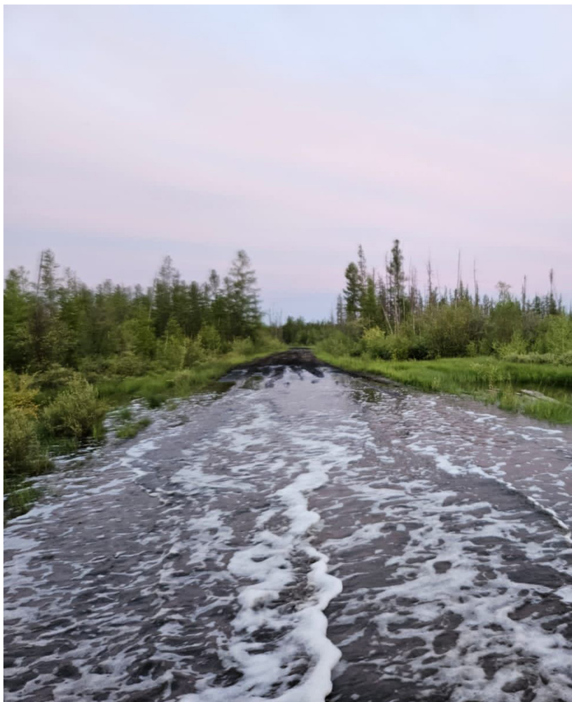
Чуукаар – Киров айан суола ардахтар кэннилэриттэн.

“Основа” ХЭТ суол онгоһуутугар кыттыһаахпыт диэн эттэ, суол онгорор техникалара барыта баар. 2020-2022 сылларга бу тэрилтэ Маалыкай-Хатыы суолугар 44.066.820 солк. суумаҕа өрөмүөн үлэтин ыппыта. 1 килэмиэтир