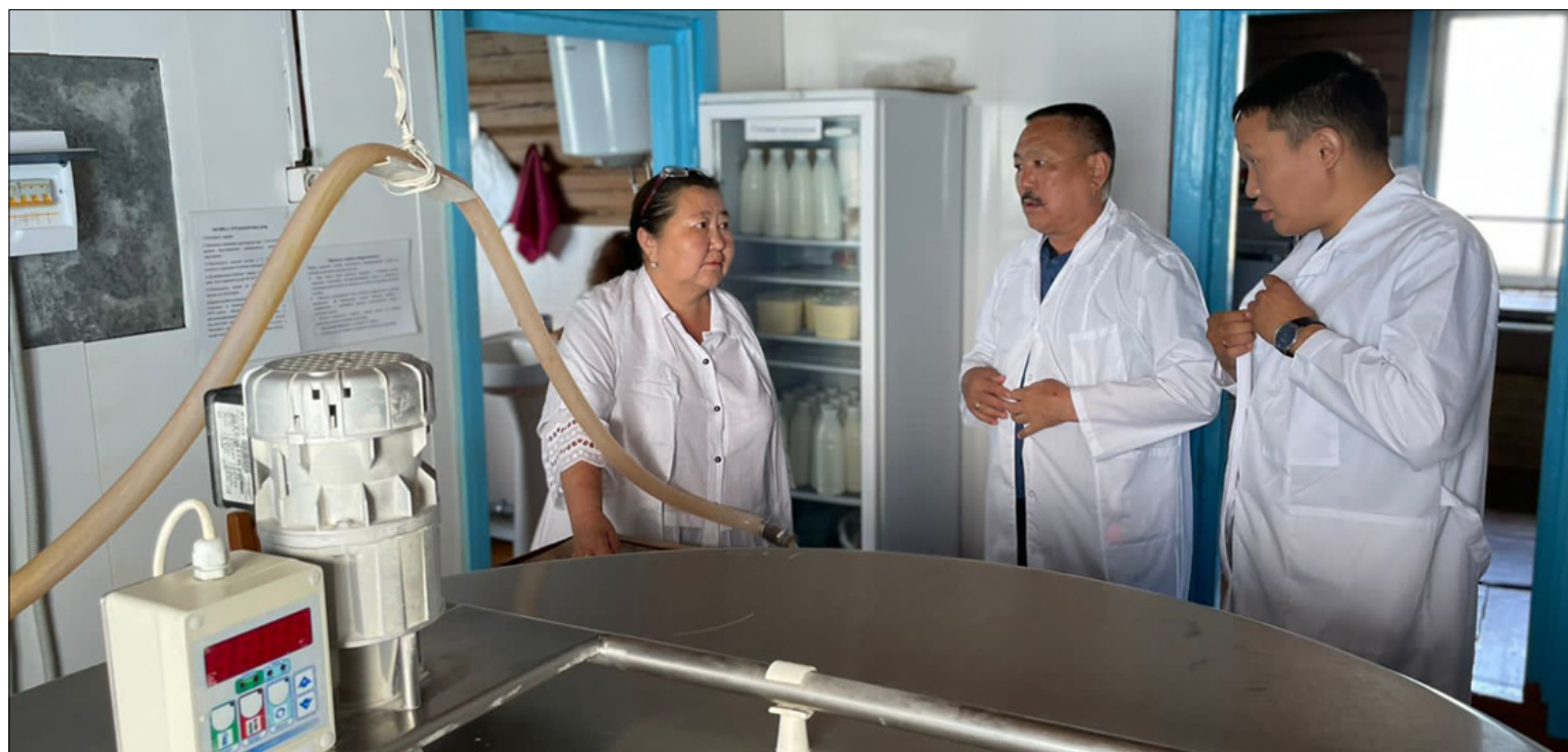
Хорулаҕа “Уйгун” СППК улууска биир үчүгэй көрдөрүүлээх тэрилтэ. Нэһилиэнньэҕэ таһаарар үүт аһа атыгыга хамабатык барар.