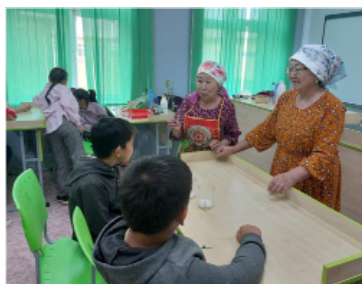
Бабушки проводят мастер-класс