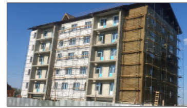
«Нидстрой» ХЭТ тутар дьизэ.