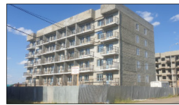
Комсомольской уул. 99 № тутула турар дьизэ

53 кыбартыралаах дьизэбэ 40 киһи үлэлиир. Холлоҕоһо бүтүтэ, 1,2, 3 этээстэр эркиннэрин таһаардыбыт. 1, 2 этээстэр эркиннэрэ штукатуркалар, аллараа цокольной утеплениета бүтүтэ, үөһэ сарайын оҥоро сылдьабыт. Үлэтэ өссө да элбэх, ол эрээри болдьоммут кэмигэр бүтэриэхпит. Бэйэбит оробуо-