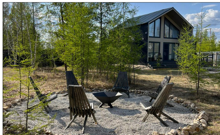
Бысыкатовтар былырыын тутан үлэбэ киллэрбит «Скай-хаус» сыһыналан дьизэлэрэ.

●●● - Оннук. Билигин торт астаан биирдүүлээн атыыга таһаар кыргыттар элбэхтэр. Маҕаһынарда даҕаны талбытын баар. Элбэх торт астаан атыылыыр да эрдэһинэ сакааһым баар буолааччы, ол эрэн билигин өр кыһаллан, санаабын, айар дьобурбун ууран туран онгоробун быдан ор-