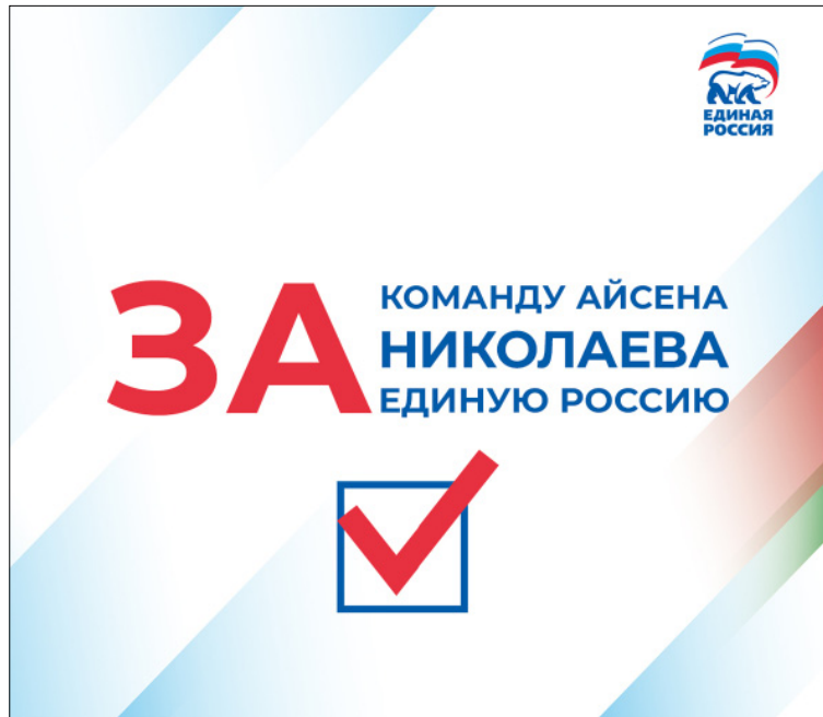
Площадь предоставлена ЯРО ВПП «Единая Россия» на безвозмездной основе.