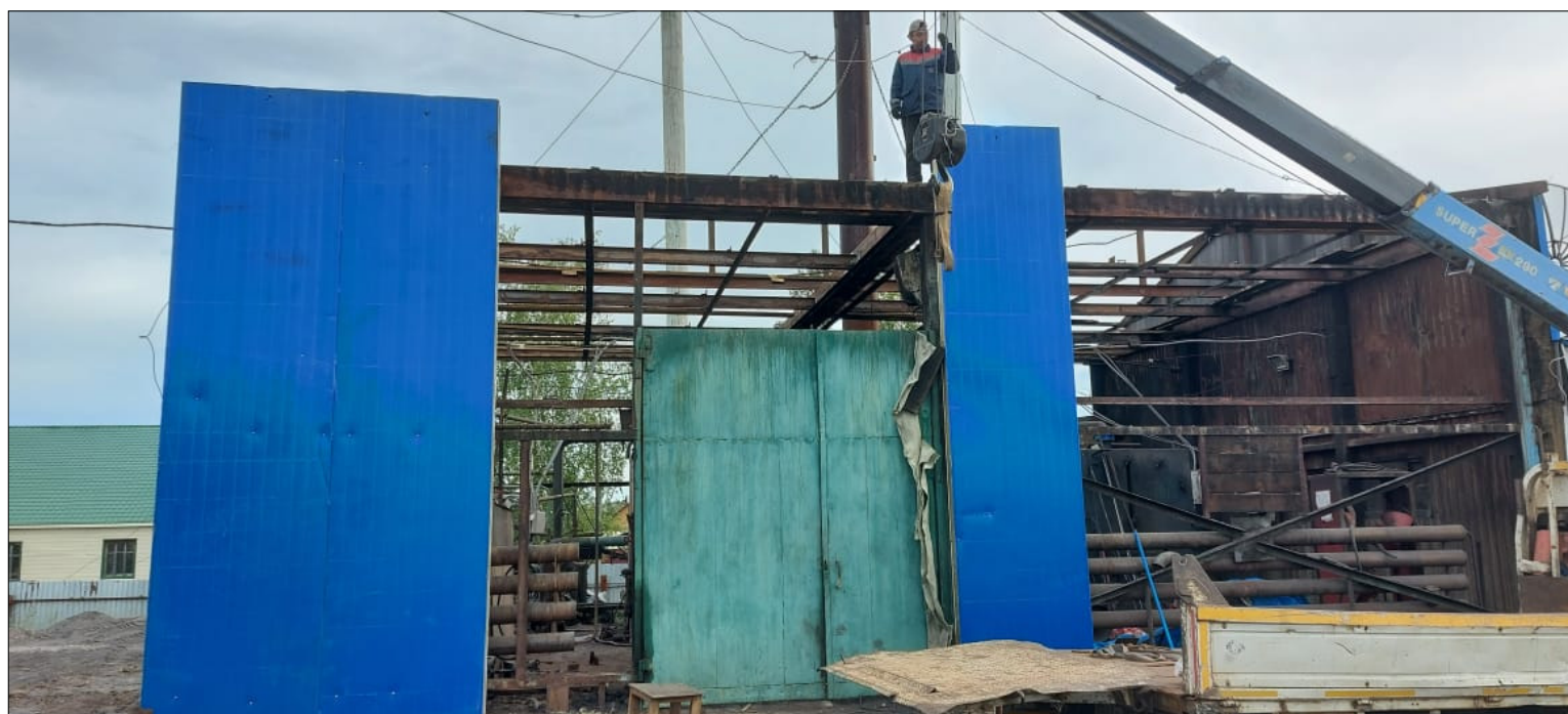
Акана кварталнай хочуолунайа өрөмүөннэнэр.

●●● - Быйыл 960-нуу миэтирдээх иттии уонна уу ситимнэрин хапытаалынай өрөмүөнүн онгоробут. Антоновка нэһилиэгэр эбии үбүлээһин быһытынан 600 миэтир иттии ситимин уларытыахтаахпыт. Туох-баар өрөмүөн үлэтин матырыйааллара бүтүннүү баар,