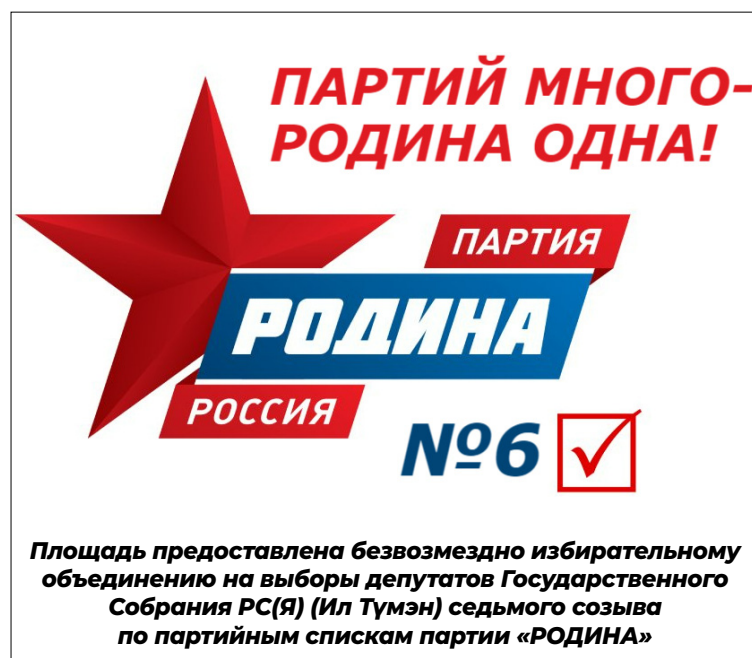
Площадь предоставлена безвозмездно избирательному объединению на выборы депутатов Государственного Собрания РС(Я) (Ил Түмэн) седьмого созыва по партийным спискам партии «РОДИНА»