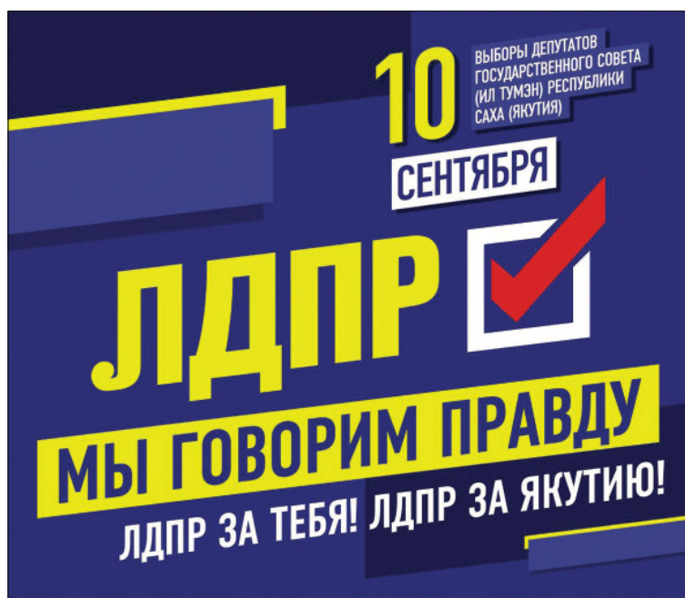
Площадь предоставлена ЯРО ВПП «ЛДПР» на безвозмездной основе.