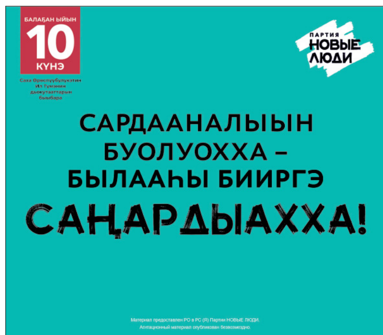
Площадь предоставлена ЯРО ВПП «Новые люди» на безвозмездной основе.