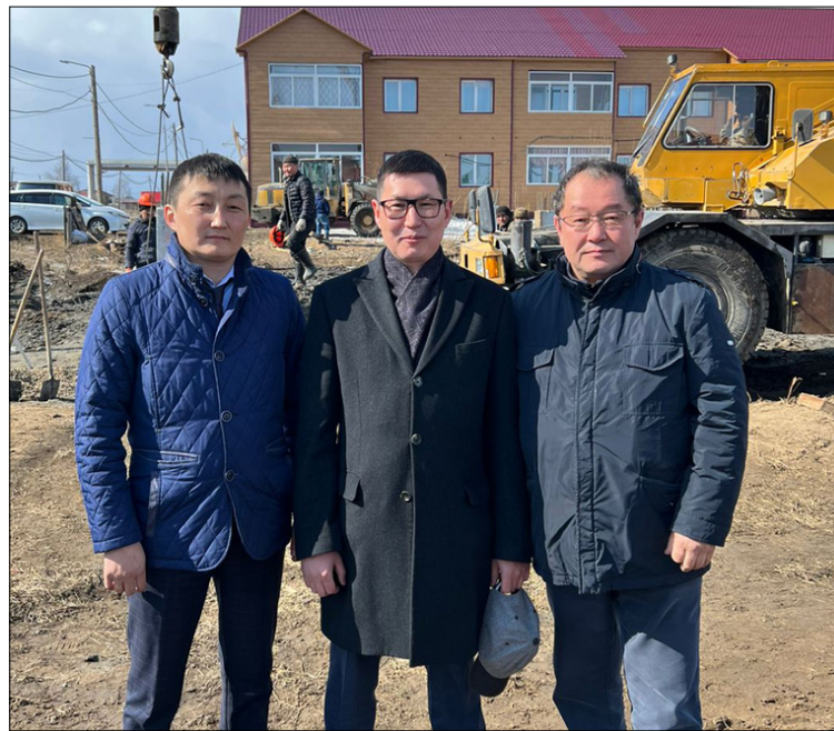
● Былырын Нурбаҕа 5 этээстээх икки олоһор дьиэ сыбаайатын түһэригэ.

●●● - Эппитим курдук, тутуу эйгэтигэр 2000 сылтан үлэлибин. 2003 с. төрөөбүт дойдубар Нурбаҕа үлэли кэлбитим. Ити сыл ыам ыйыгар үөрэммит оскуолам тас эписийин онгорорго хантараак түһэрсэн үлэбитин саҕалаабыппыт.