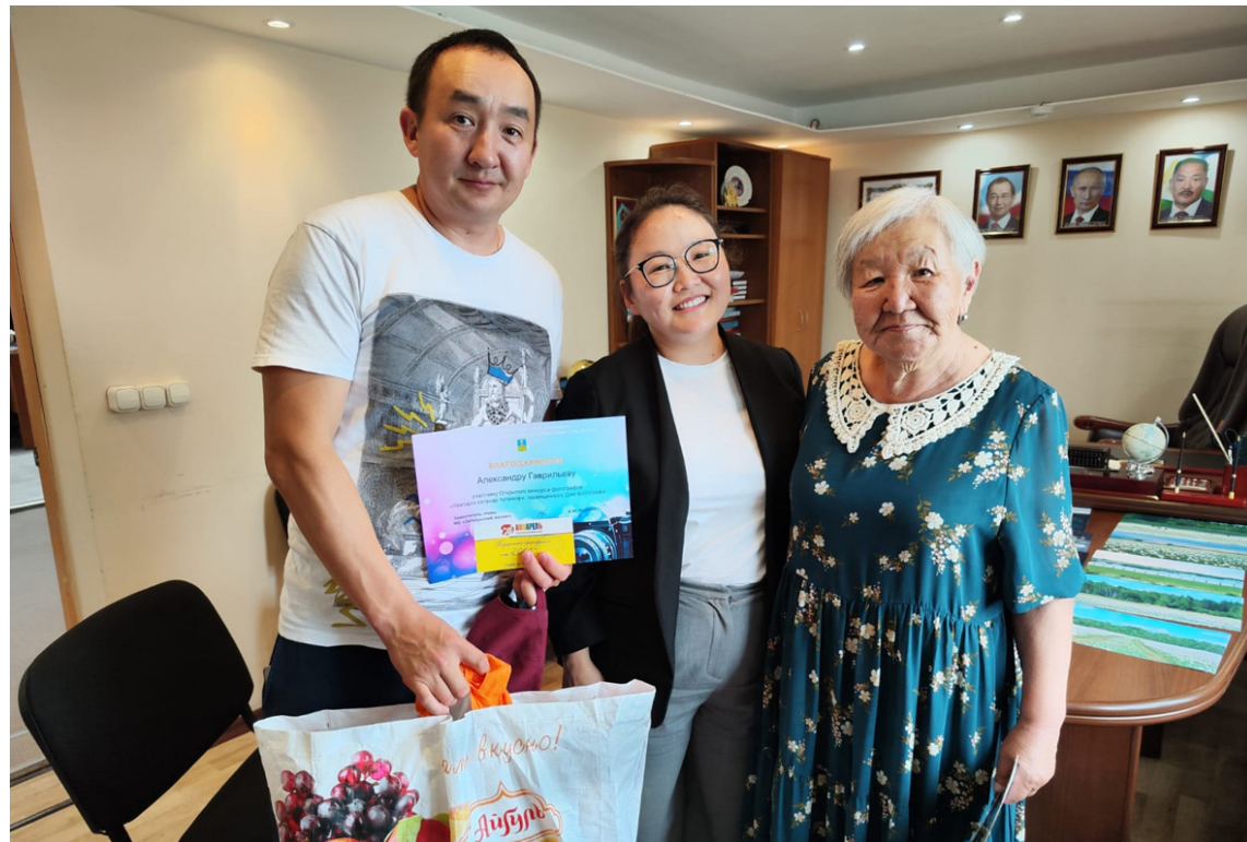
Күрэх кыттылааһар Александр Гаврильевка Клавдия Васильева анал бириинин туттарда.

тория диэн өйдүүр буолбуттар диэн үөрэр.