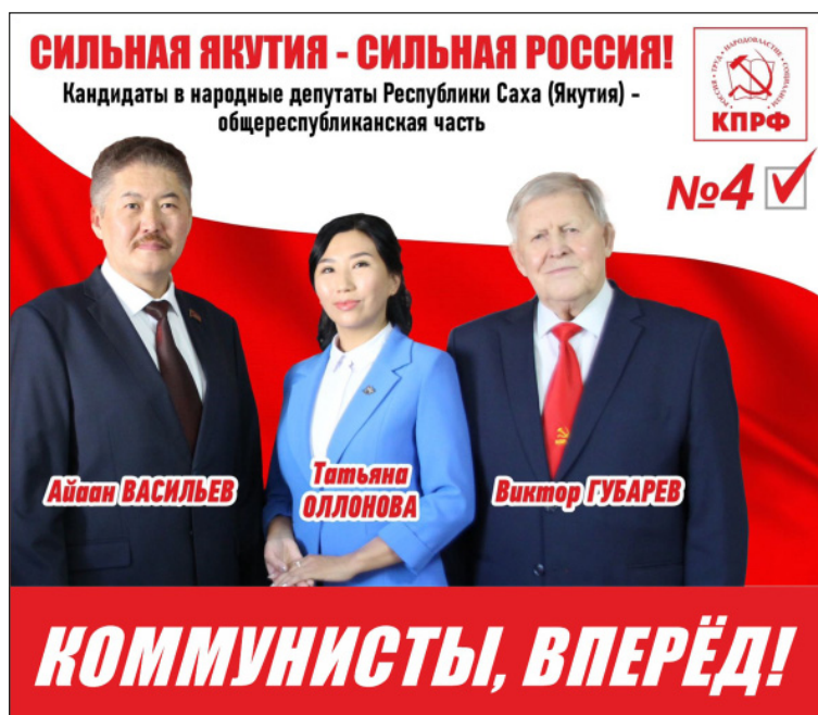
Площадь предоставлена ЯРО ВПП «КПРФ» на безвозмездной основе.