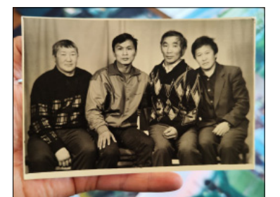
Ааспыт кэм туоһута

малларын бэйэтэ туттарбытын олохтоох түмэлгэ көрүүххэ, билсиэххэ сөп. Ити курдук ис хоһооннон бу күрэх сылтан сыл ыыта турарга бигэргэммитэ.