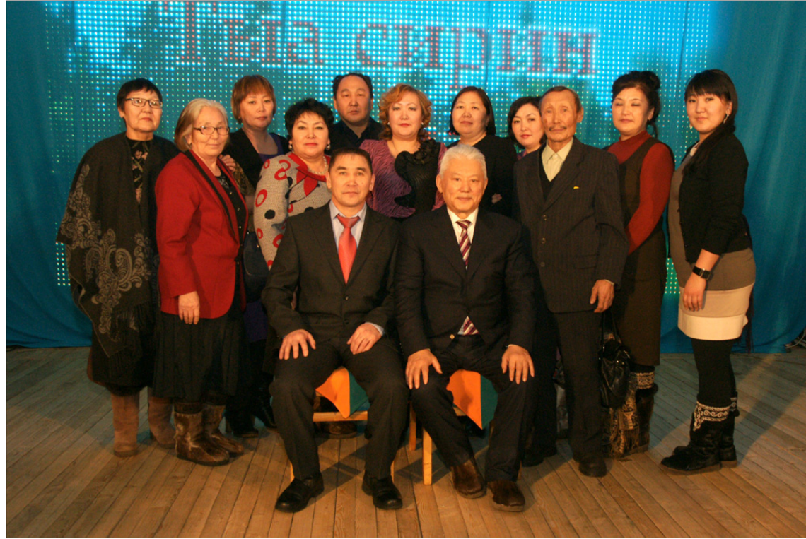
Михаил Ефимович Николаев во время встречи с жителями Антоновки. 2013 г.

Миша учился в школе, школа состояла из 2 домиков. А в наши дни в Октёмцах организована школа для одарённых детей. Учащиеся учатся в благоустроенной тёплой, светлой каменной школе. Мальчик был очень любознательным, много читал,