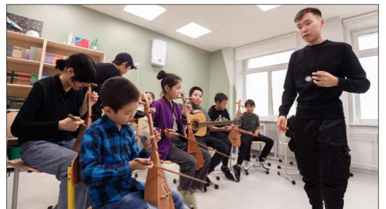
Саха төрүт музыкальной инструменнарыгар уһуйулуу түгэнэ.

Манна аһардас Чаппанда эрэ олохтоохторо буолбакка, оро-