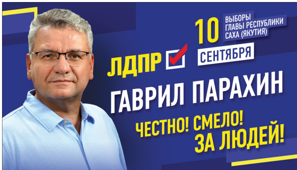
Площадь предоставлена кандидату на должность Главы РС (Я) Парохину Г.П. на безвозмездной основе.