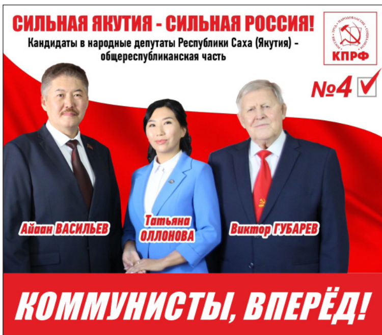
Площадь предоставлена ЯРО ПП «КПРФ» на безвозмездной основе.