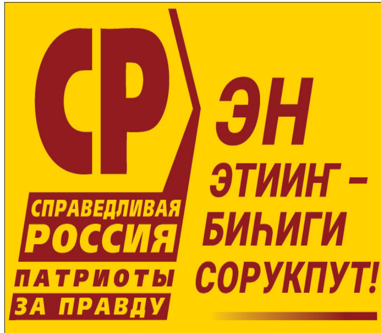
Площадь предоставлена РО СПП «Справедливая Россия» на безвозмездной основе.