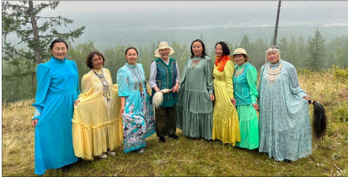
Ньурба кэрэ ангаардара Чуукаар Ытык Мырааныгар.

Саҥа сиргэ, саҥаны көрө-истэ хаамар бэйэтэ астык турук. Бары билсэр, биир тэтимгэ сылдьар, хаамары, айылбалыын