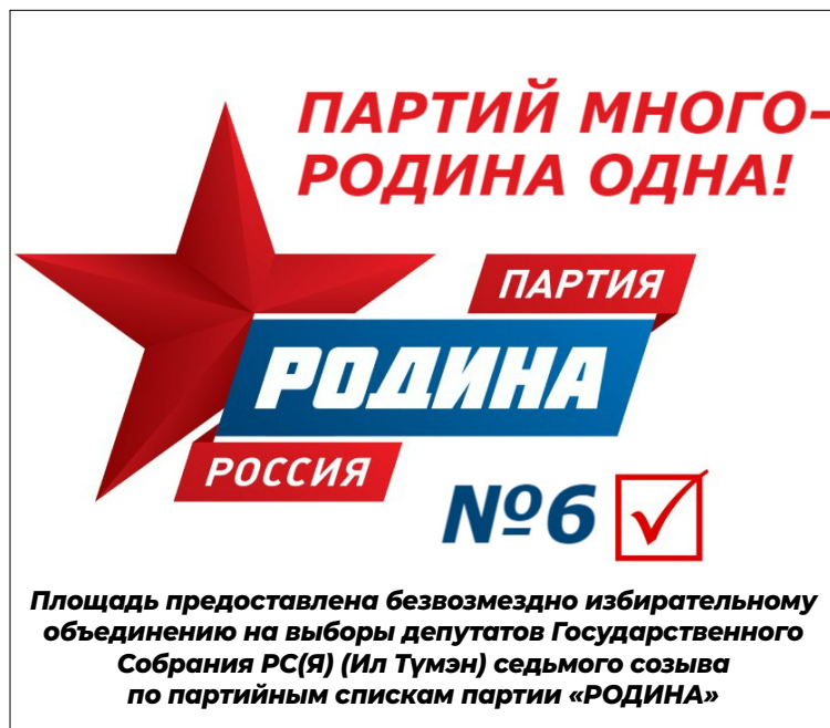
Площадь предоставлена безвозмездно избирательному объединению на выборы депутатов Государственного Собрания РС(Я) (Ил Түмэн) седьмого созыва по партийным спискам партии «РОДИНА»