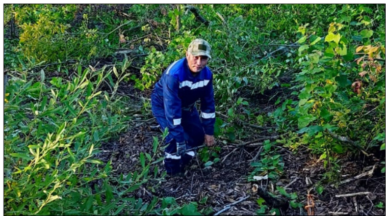
Ретле дэриэбинэҕэ щубунан разведка.

Разведка саҕана буллубут тэриллэрбит туруктарыттан (туттар мал-сал, хачыанайдык ытыгыстаан оһонуллубут холодьбас, кырыс сири тизэрэгэ аһаммыт булуук, алдыаммыт иһит-хомуос о.д.а.) бу медсанбат кыра дэриэбинэ таһыгар олохсуйбут эбит дьон түмүктэтибит. Сэрии буолбут сирэ, бааһырыт байыастарга бастагы көмө оһорор сир, бу дьэ турбут сирэ, бу дьэ умайбытын тобоҕо, манна аттары туруора сылдыһыт сирдэрэ, икки техника тура сылдыһыт ырааһытата дьон суол-суол арааран уруһуйдаатыбыт. Буллубут блиндажтарынан сирдэттэххэ, наһаа улахан санитарнай чаас буолбатах курдук. Ол эрэн халлаан арыый сылыһыт кэмнэригэр туюх да эбии оһонуута суох балааккаларынан түспүт буолуохтарынан эмиэ сөп ээ. Кыстык балаакка сирэ олох анал оһонуктаах оһоһтооһингэн. Сааскы, күһүгүтү балаакка тура сылдыһыт сирэ, тулата ханаабалаах, бэйэтэ үрдэти-