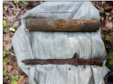
Штык нож СВТ, гильза 45 мм.