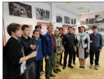
СЗФ музейыгар экспонаттары туттары.

һиккин дуу, устудьонун дуу анаа диэн ис хоһоонноох этэ. Саха киһитин буларбыт буоллар, дойдутугар Саха сиригэр аһалан көмүө этибит диэбитим. Ону бастаан 5 киһини аныаһытын сөп диэн үөрдүбүттэрэ. Онтон биһиги бары ороскуопутун бэйэбит уйунан барар дьоммут диэбиппиттэн куттаммыттара эбитэ дуу, атын туох эрэ биричиинэнэн эбитэ дуу, аккаастаабыттара. Ржевка барабыт, икки аңы хайдыбаппыт диэн быһаарыбыттара. Хара баттахтаах булбут буйуттарбыт уопсай көмүүгэ бардахтара ол. Азияҕа хара баттахтаах омуһ элбэх. Пинаевы Горки таһыгар братскай көмүү баар, сонно үрдүгэр кыра музейдаах. Онно көрдөххө ити түбэһэ элбэх казах дьонно көмүллүбүттэр эбит. Онон сылыктаатаахха, хара баттахтаах буйуну муһа казах да буолуон сөп курдук.