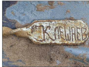
Луоскаҕа буйун аага.

Быйыл саас чуолакай Старай Руссаҕа көрдүү барарбыт биллибит кэннэ СВФУ ректорыгар сурук суруйбутум. Ньизэмэстэр көмпүт дьоннорун көрдүү барабыт. Баһар саха дьонун булуохпут. Туох да дөкүмүөннэрэ суох буолуо, унуохтара эрэ хаалбыт буолуохтаах, ол иһин ол унуохтарынан саха киһитэ баарын суоһун быһаарарга анал үлэ-