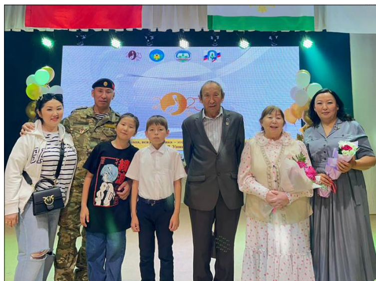
Учуутал күнүгэр Федоровтар династияларын чиэстээһин.

тэхтэн Бүлүү педучилищетын 1 кууруһун бүтэрбитэ, эһилигэр Дьоккуускайга пединститут бэлэмнэни кууруһугар үөрэммитэ. Оттон 1948 с. пединституту бүтэрбитэ. Араас сылларга холкуоска, ааҕар балаҕанга эмиз үлэлээбит, Акана начаалынай оскуолатыгар сэбиэдиссэйдээбит, военруктаабыт.