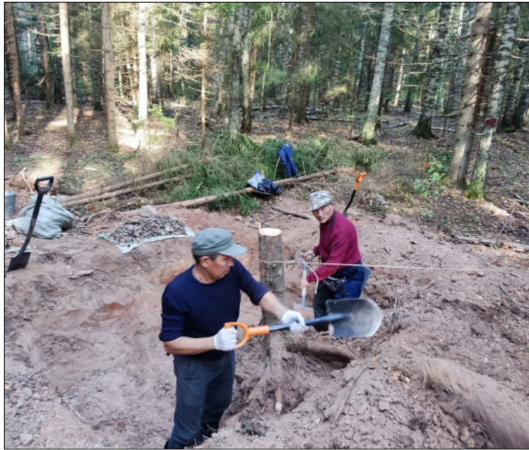
Хаһыы түгэнэ, үрдүгэр мас үүммүт.

алдыапат буола сатыыбыт. Сотору-сотору "Славик!" дэһэбит, ыңгыран сүбэлэттэрэбит. Святослав улахан баһайы бакыр быһахтаах, туттарга наһаа табыгастаах.