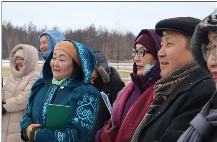
Бүлүү өрүһүн хангас салаата – Марха өрүс аатынан 19 үйбэ Марха улууһа диэн баар буола сылдыбыт. 1824 сыллааха төрүттэммит биллэр, онон эһиил, 2024 сылга, Марха улууһа төрүттэммит өрөгөйдөөх 200 сыла туолар.

Бу улуус Марха өрүстэн Үөһэ Бүлүү анныгар Бүлүү өрүскэ диэри улахан сири тайаан сыппыт. Онтон 1930 сыллааха бу улууспут Ньурба улуугар уларыйбыт. Марха улуунун киининэн билингитэ Таркаайы нэһилигэ (Марха) этэ. Биер кэмгэ манна кулубанан