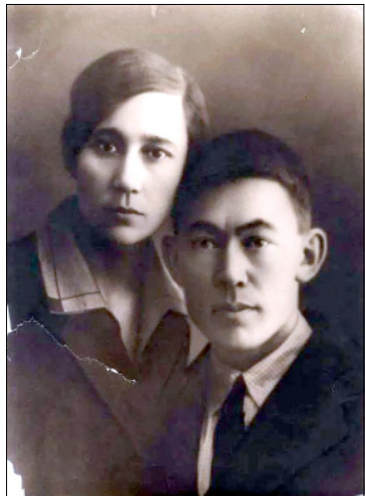
Надежда Евменьевна уонна Парфений Никитич Самсоновтар.