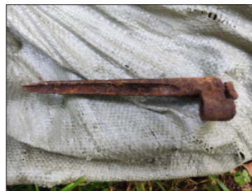
Мосин винтовка ыстыгыга.

Буйуттары үксүн 1 миэтир кэринэ дирингэ көмөллөр эбит. Арай биһир буйуну 1,5 м диринтэн буллубут. Тоҕо оннук чуолаан кинини эрэ диринник көмүттэрэ буолла, чийэс бочуот биһир көрүңэ эбитэ дуу.