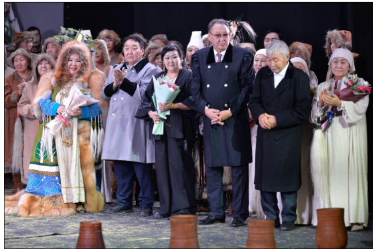
Премьера үөрүүлээх чааһа

- Нурба улуунун 9 нэһиликтэриттэн үс көлүөнэ: аҕам, орто саастаах, эдэр көлүөнэ ыччаттар кытыннылар. Манна нэһиликтэр кулууптарын үлэһиттэрэ, Нурбатааһы ЫБМ, ОДьКХ, үөрэ-ҕирииттэн иштээччи, учуутал