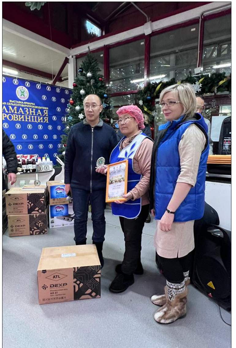
«Маалыкай» ТХПК аһа-үөлэ эмиэ сыаналанна