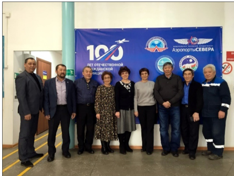
Өр сылларга үлэлээбит Нурба авиапордун кэлэктибин кытта

Кэлин, пенсияҕа тахсан, эдьийим Нурбаҕа «Сардаҥа» түмсүү, куоракка көһөн кэлэн баран, "Нурбакаан" түмсүү актыыбынай кыттылааҕа буолан, ытыллар тэрэһиннэргэ барытыгар сылдьан, үгүһүлүүр, хомуска оонньуур. Биир дойдулаахтарыгар, дьүөгэлэригэр өрүү сүбэ-ама, өйбүл буолааччы. Ол иһин даҕаны,