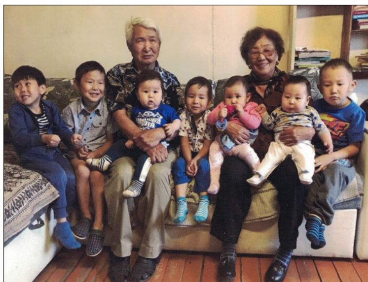
Мип-минньигэс хос сиэннэринэн

"Нурбакаан" түмсүүтүн кыттылаахтарын туруорсууларынан Саха Өрөспүүбүлүкэтин Ытык Сүбэтин чилиэнин аатын киниэхэ ингэрибиттэрэ элбэҕи этэр.