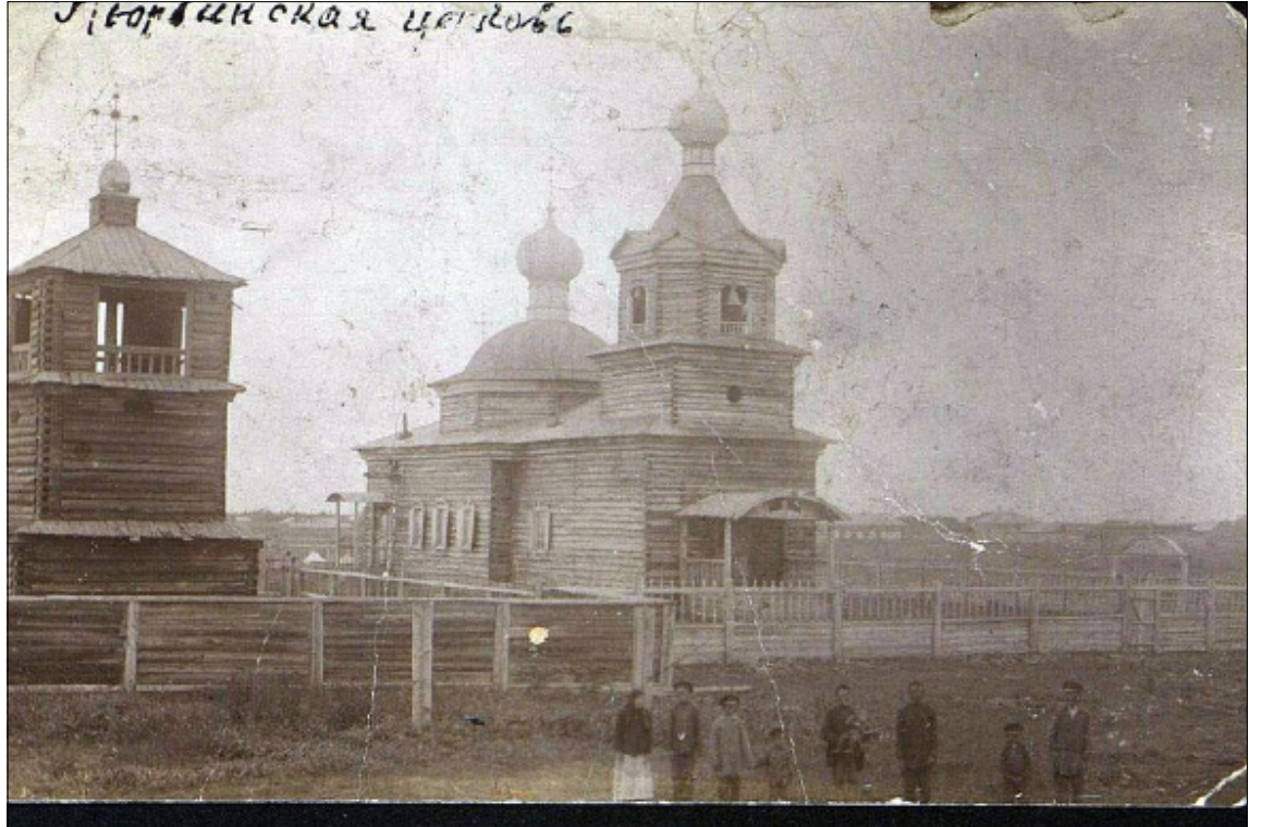
Дореволюционное фото из фондов Государственного Исторического Музея

1763 сыллаахха синод укааһынан сибир епархиятыгар икки сана дуоһунас баар буолбута. Иркутскай епархиятын биир Итэҕэлгэ сирдэбитэ Саха сиригэр олонор үлэлиэхтээҕэ. 1765 сыл балаһан ыйыгар Саха сиригэр Итэҕэлгэ сирдэбитинэн, Үөһэ Бүлүү таңаратын дьизэтин аҕабыта Григорий Ногавицын аһааһыта, кини үлэтэ үрдүктүк сыаналаммыт: «...трудолюбив, прилежен, немало якутских инородцев обратил в христианство и уже священств-