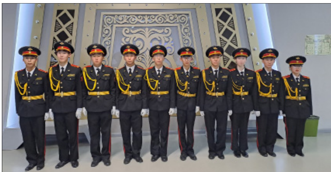
● «Искра» байыаннай-патриотической кулууп