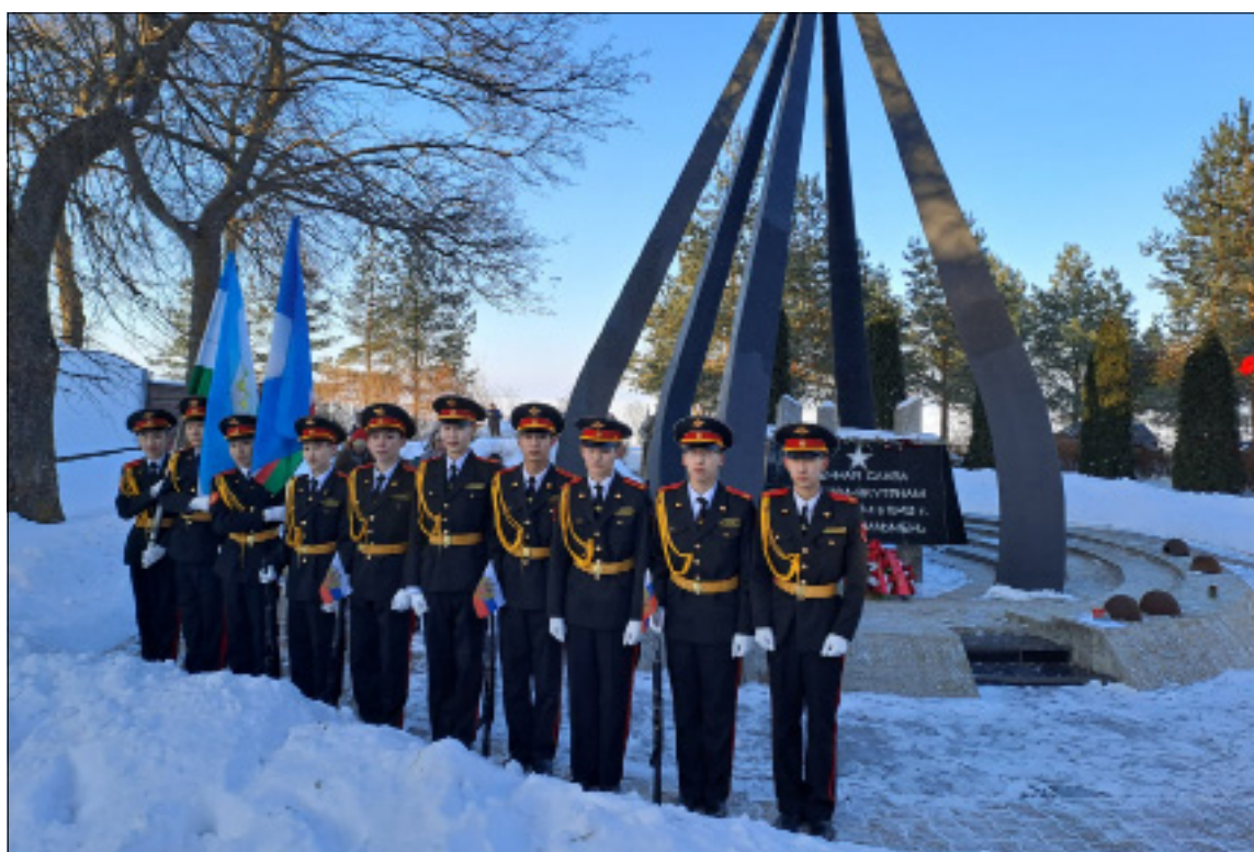
● Нижнэй Новгородка Ильмень күөлгэ

билиһиннэриг эрэ. ●●● - Улуустаабы үөрэҕири салалтата, спорт управлениета уонна оҕо спортивной окулата үөрэнээччилэргэ анаан спартакиада тэрийэн ытыгытаах, онон элбэх күрэхтэһиилэр ытыгылаахтара.