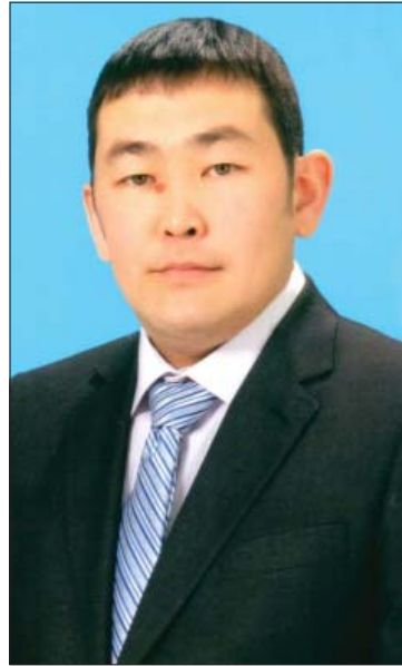
уонна онно туох ылылларый?

- Бырайыаккытын олоххо киллэрингэ төһө үп эһинэх көрүлгүригэр?