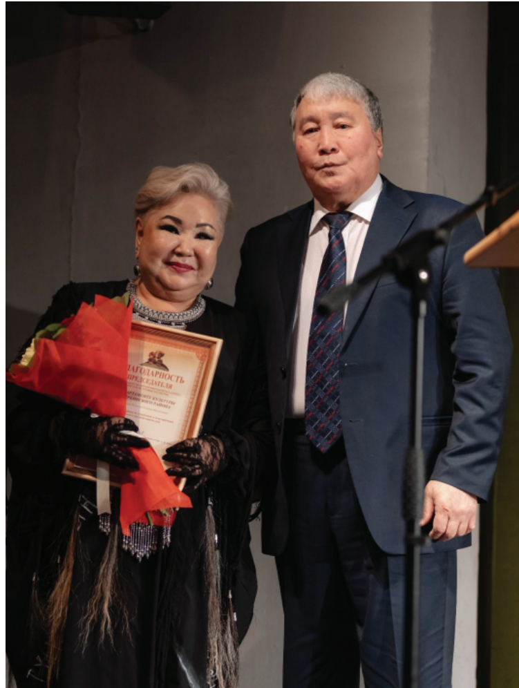
Судаарыстыбаннай театрынын арыый да хойугу тэриллибитэ, 1966 сыллаахха. Ол курдук,