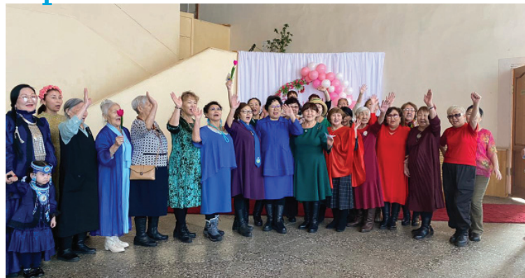
саастаахтар үлэлэрин сэргий көрдүлэр.

Куорат түөлбөлөрүн кэрэ анаардара параадтаан тахсан хаамтылар.