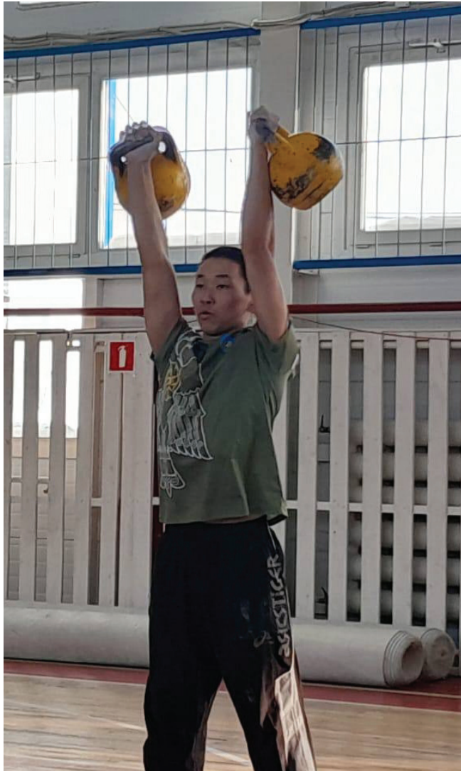
эрэнэбит. Ол курдук күрэх түмүгүнэн: