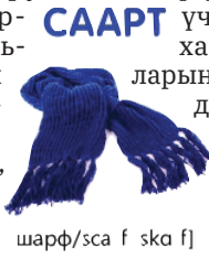
шарф/sca f ska f]