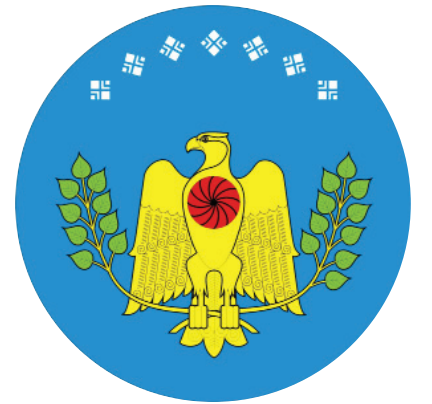
Ньурба улуунун гербэтэ