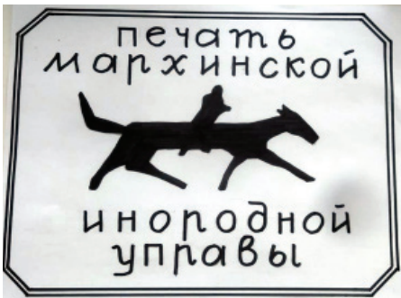
Марха улуунун быраабын бэчээтэ

Икки сүүс сыл анараа өртүгэр Үөһэ Бүлүү улууһа олус кизгэ сабардаан сытарынан, салайарга уустугунан, улууһу икки ғына хайтарга диэн буоластар (нэһиликтэр) кинээстэрэ мустаннар, хас да төгүл мунньахтааннар манньк быһаарбыттар: Үөһэ Бүлүү улууһа 5 буоластаах, 2332 дууһалаах, киинэ Ороһуга буоларыгар; Марха улууһа 8 буоластаах, 5093 дууһалаах, киинэ Муоһаныга (Хатын Сыһыыга) буоларыгар.