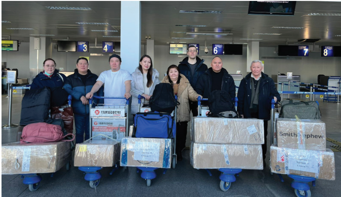
Мобильное хирургическое отделение ГБУ РС(Я) ЦЭМП: